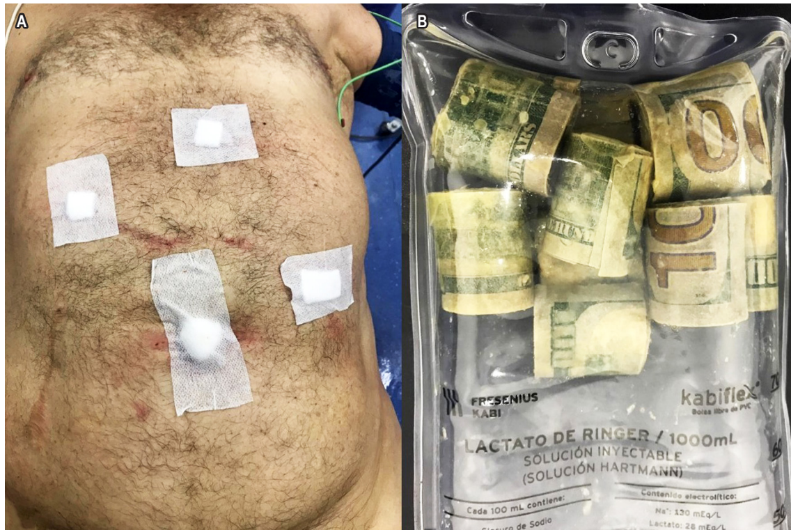
Figura 2. A. Se observa al paciente quien fue intervenido por vía laparoscópica, luego de la extracción del bezoar de dinero. B. Bezoar de dinero luego de su extracción.

de la policía, como ente de control y vigilancia, la cual se encargó de realizar los procesos subsiguientes.