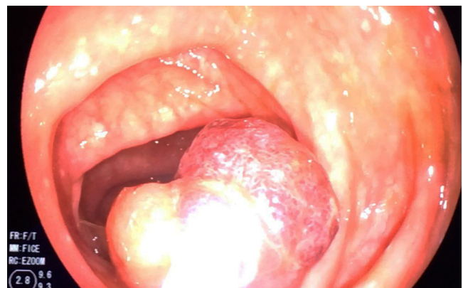
Figura 4. Recuperación del pólipo del colon resecado.

Se decidió entonces realizar una polipectomía endoscópica. Además, ante el tamaño del pedículo, se optó por insertar un lazo hemostático ( endoloop ). Luego de ello, se usó el asa de polipectomía y se resecó el pólipo (Video 1).