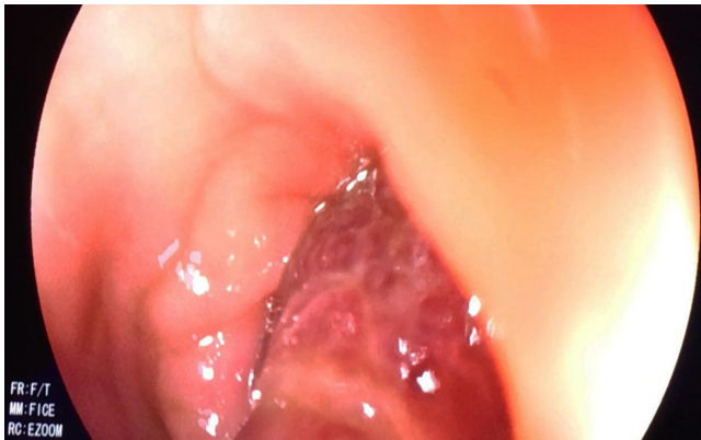
Figura 1. Gran pólipo pediculado del colon.

Durante la hospitalización, el paciente presentó una agudización de los síntomas, que se agravó por una rectorragia. Por este motivo, se solicitó realizar una colonoscopia total, en la cual se observó un gran pólipo pediculado de 40 mm, con un pedículo largo de aproximadamente 30 mm en el colon sigmoide, que mostró un prolapso causado por peristaltismo, lo que generó una obstrucción de la luz colónica (Figuras 1-4). La cabeza del pólipo estaba erosionada como una probable causa de rectorragia.