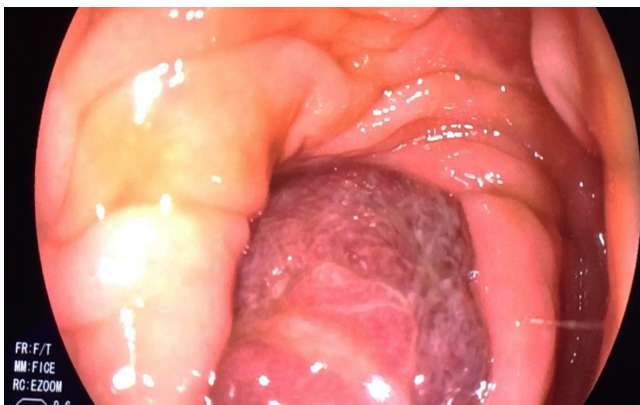
Figura 2. Pólipo del colon que ocluye en su totalidad la luz colónica.